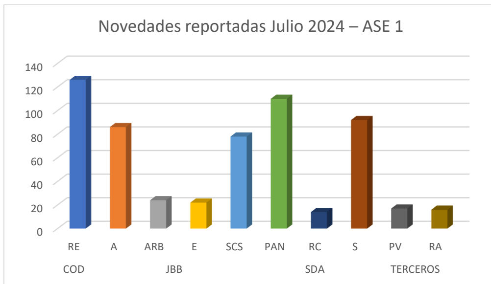
Gráfica 3. Novedades reportadas Julio 2024 – ASE 1

La mayor cantidad de reportes durante el mes de Julio de 2024 estuvo relacionada con Riesgo eléctrico Codensa ( 21,5% ); como se observa en la siguiente gráfica: