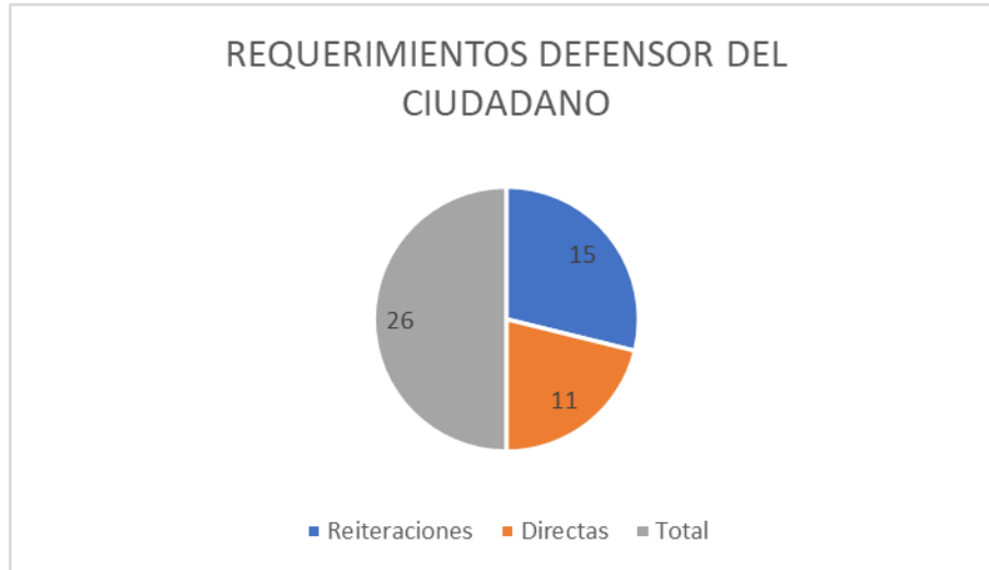
Grafica 1. Defensor del Ciudadano 09-2018 / 10-2019

De acuerdo con la gráfica 2 se evidencia que el mayor número de requerimientos fueron recibidos durante el mes abril correspondiente al 30.77%, seguido por el mes de mayo correspondiente al 23.08%, de igual manera se evidencia que en el mes de agosto no se recibió ningún requerimiento dirigido al Defensor del Ciudadano.