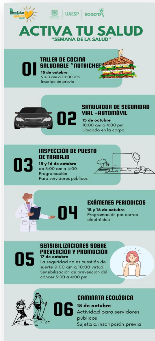
Ilustración 2 Pieza Comunicativa semana de la salud