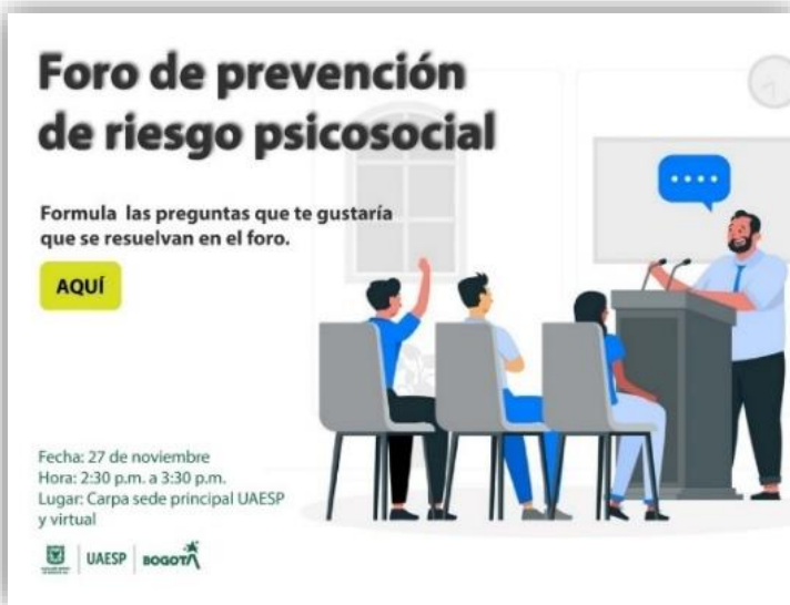
Ilustración 3 Pieza foro prevención riesgo psicosocial

El foro fue un espacio abierto dirigido a todos los funcionarios públicos, diseñado para abordar el tema de la prevención de riesgos psicosociales en el entorno laboral. Previo al evento, los participantes tuvieron la oportunidad de enviar sus preguntas y dudas a