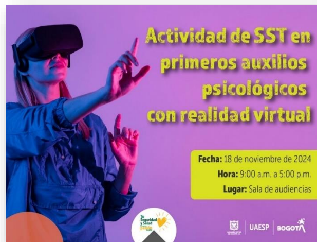
Ilustración 5 Pieza comunicativa de primeros auxilios psicológicos realidad virtual

En el cuarto trimestre se ejecutaron actividades enfocadas a la prevención del riesgo psicosocial con la finalidad de brindar herramientas a los participantes para ofrecer apoyo emocional inmediato y adecuado a personas que hayan experimentado una situación de crisis o trauma, utilizando técnicas de intervención que ayuden a estabilizar la emocionalidad de la persona afectada.