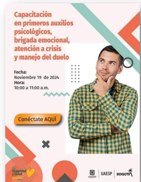
Ilustración 1 Pieza comunicativa capacitación prevención de riesgo psicosocial

La Capacitación en Primeros Auxilios Psicológicos, Brigadas Emocionales y Manejo de Crisis está diseñada para proporcionar herramientas prácticas que permitan identificar, atender y manejar situaciones de crisis emocional en el entorno laboral. Incluyó conocimientos básicos en primeros auxilios psicológicos para brindar apoyo inmediato ante estrés agudo o eventos traumáticos, la importancia de brigadas emocionales que promuevan el bienestar y actúen como primeros respondientes, y estrategias para la atención y manejo efectivo de crisis y poder ayudar a la comunidad de la UAESP. Facilitador ARL Positiva.