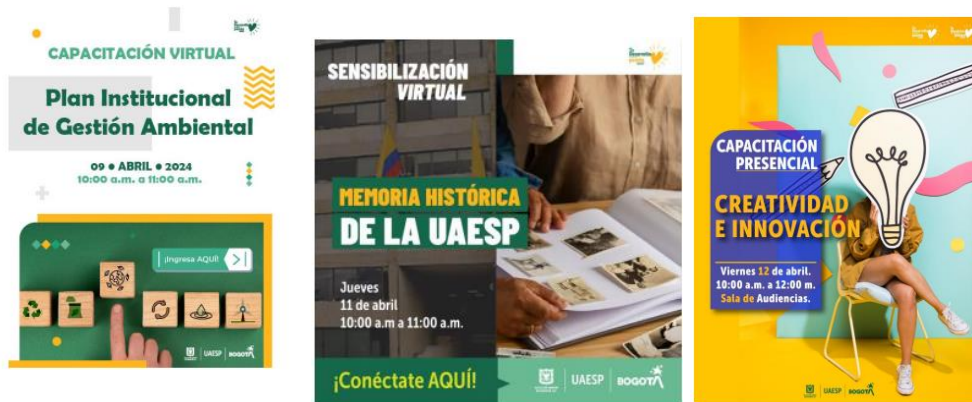
Gráfica 1 Evidencias Capacitaciones abril