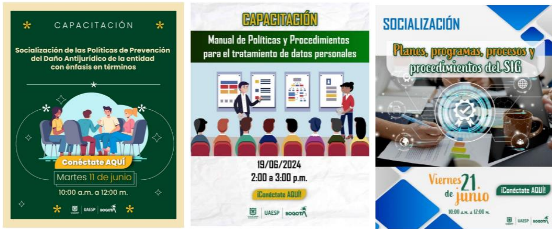
Gráfica 3 Evidencias Capacitaciones junio