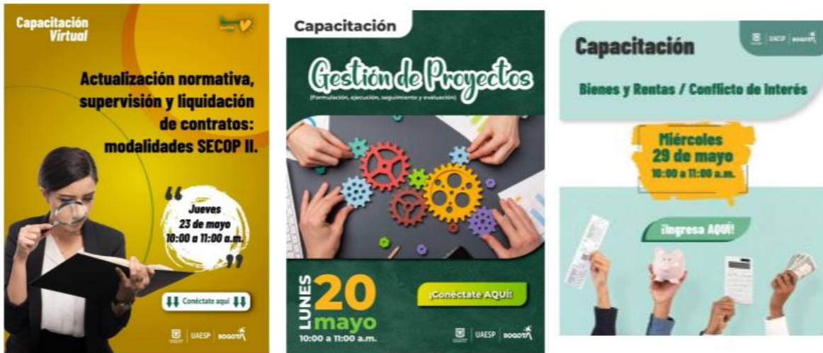
Gráfica 2 Evidencias Capacitaciones mayo